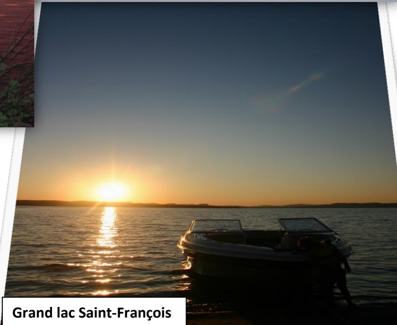
Grand lac Saint-François